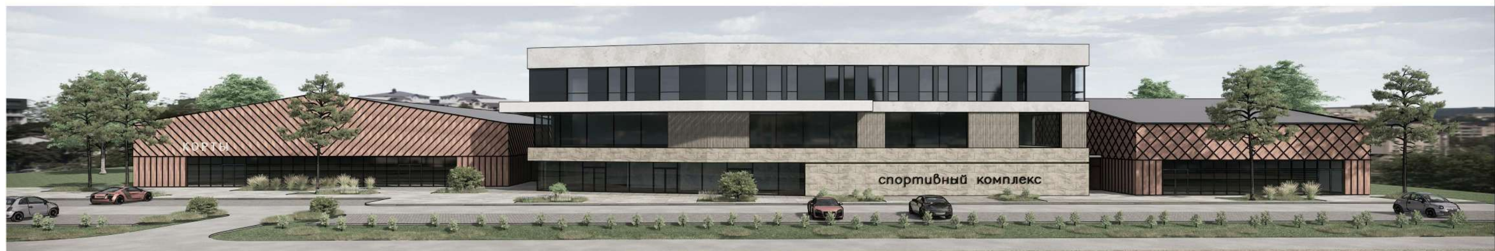
Спортивный комплекс в г.Ставрополе по ул.Черниговская-12